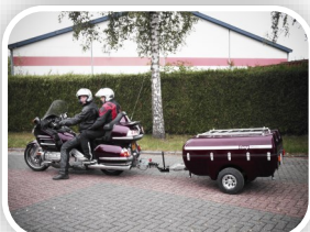
Ook voor de motor