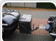
Disselframe voor eventueel keukenblok