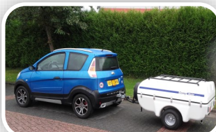
Ook voor Brommobielen