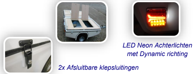
2x Afsluitbare klepsluitingen