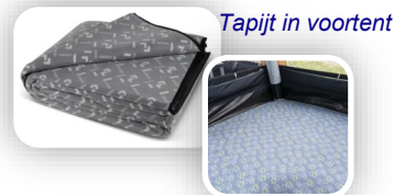
Tapijt in voortent