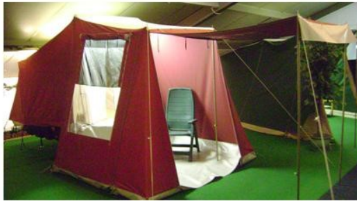
CampMaster achter de motor