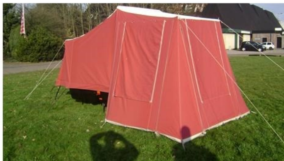
Tent geheel gesloten