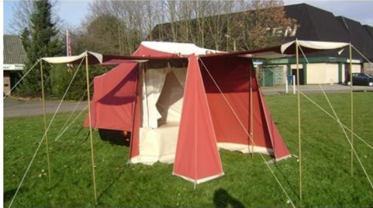
Opening van de twee deuren.