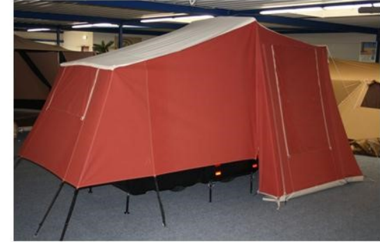
Extra accessoires: grondzijk