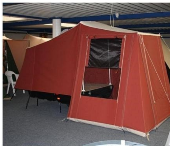
De twee ingangen zij voorzien van een raam met een ventilatie venster.