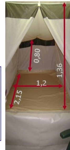
Groot bed lengte 2,15 mtr.